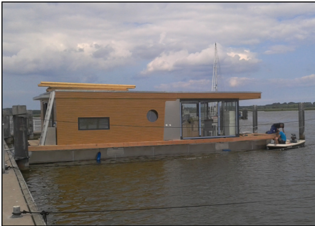
Ansicht Hausboot auf der Marina in Kröslin