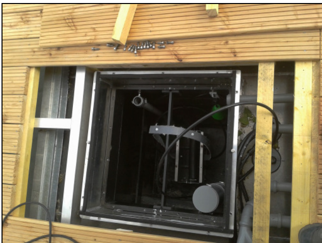
Tank 2: Membranstufe im Backbord-Schwimmkörper