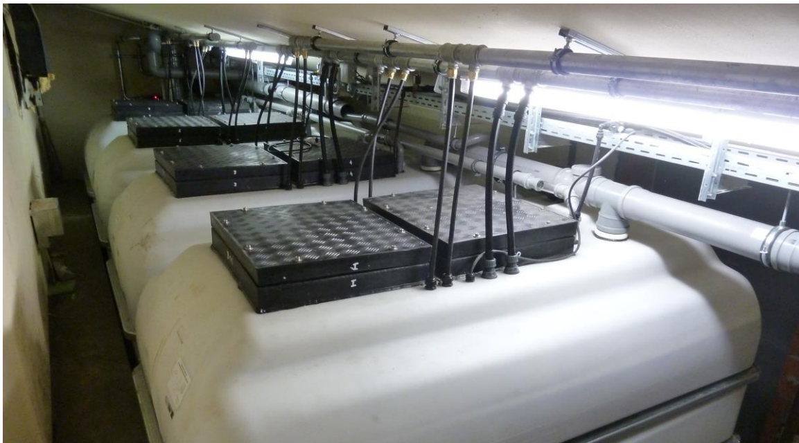
Aufstellung der 4 Belebungsstanks á 5.000 Liter Fassungsvermögen im Technikraum der Liegenschaft