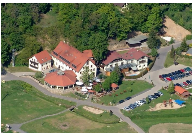
Luftbild Erlebnishotel „Zur Schiffsmühle“