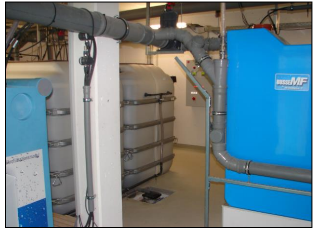
Abwasserrecyclinganlage im Technikraum des Wohnkomplexes