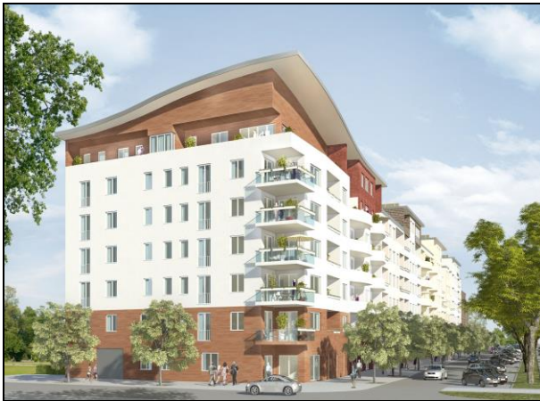
Gesamtansicht des Wohnkomplexes in Berlin-Charlottenburg