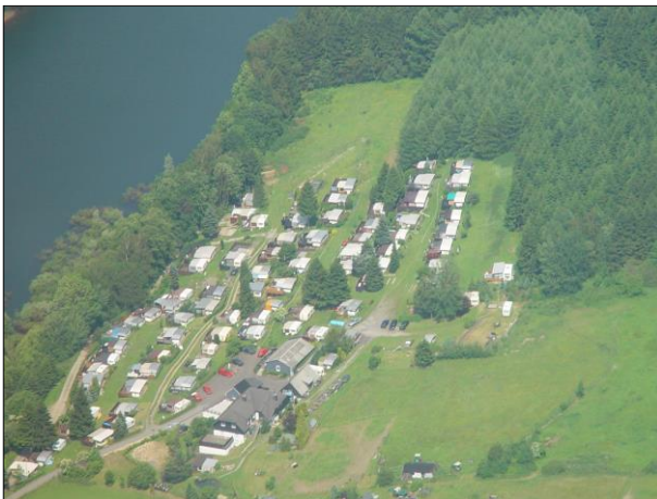
Luftaufnahme Campingplatz / Oestertalsperre