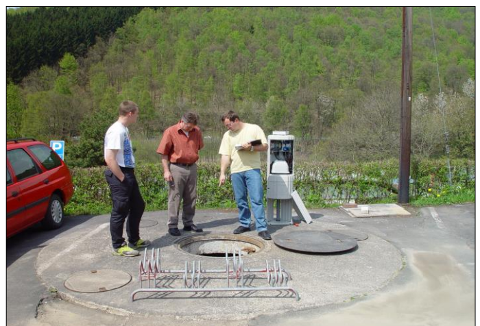
Außenansicht Grube mit Steuerungskasten