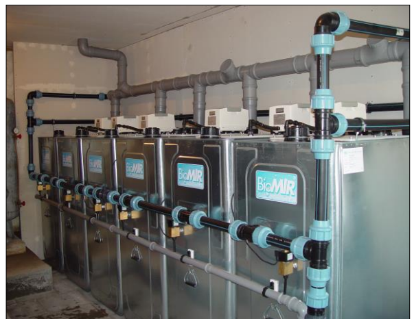
Kläranlage bei Nutzung vorhandener Grube