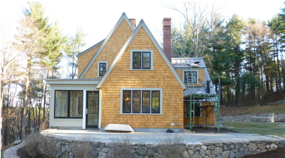
Außenansicht Essex-Hausprojekt der US-TV-Show „This Old House“

In der US-TV-Show „This Old House“ werden Hausrenovierungen mit der Kamera begleitet. Aus „alten Häusern“ entstehen über mehrere Wochen wahre Schmuckstücke mit modernem Design und ausgefeilten Techniklösungen. Im „Essex-Haus“ kommt unter anderem eine BUSSE-MF für 8 Personen zum Einsatz. Mehr Informationen zur TV-Show unter: http://www.thisoldhouse.com (The Essex House)