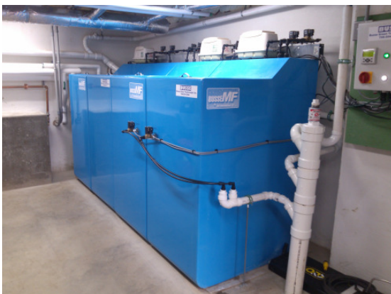
Aufstellung BUSSE-MF im Keller des Hauses